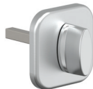
4. ПОВОРОТНИК для ночной задвижки